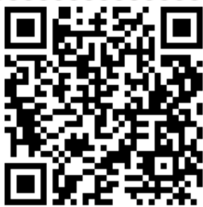
Линейка моделей МосПласт ПРО

ПРО-5; ПРО-6; ПРО-8; ПРО-10; ПРО-12; ПРО-15; ПРО-20; ПРО-25; ПРО-30; ПРО-50; ПРО-75; ПРО-100; ПРО-150; ПРО-200.